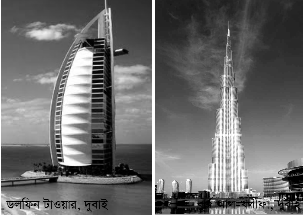
ডলফিন টাওয়ার, দুবাই

তার ভাল সম্পর্ক। ফলে পীস টিভি কর্তৃপক্ষের সাথে তিনি সময় দেন। উভয়েই উচ্চ বেতনের চাকরী করেন অনেক দিন যাবৎ। অফিস